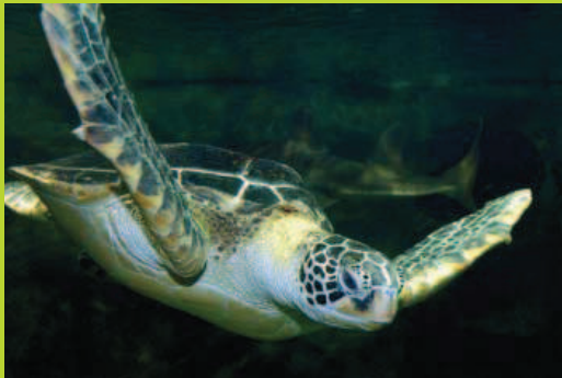
une tortue marine