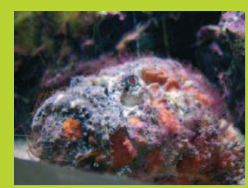
Un poisson pierre